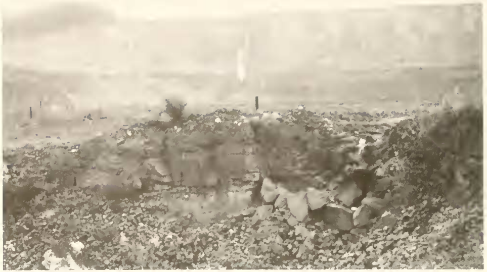
Abb. 1: Steinbruch Winnberg der Heidelberger Zement AG, Sengenthal b. Neumarkt/Opf., September 1986. Blick von W nach F. Der Pfeil markiert die Grabungsstelle. Vordergrund: Eisensandstein (ob. Aalen); Mittelgrund: Schichten von Bajoc bis oberes Oxford ( bifurcatus -Zone); Hintergrund: bifurcatus -Zone bis bimammatum -Zone (ob. Oxford).

Untersuchungen an Algen-Schwamm-Biohermen, die auch den Steinbruch Sengenthal einbeziehen. Stratigraphische Untersuchungen werden auch von Mitgliedern der „International Subcommission on Jurassic Stratigraphy“ durchgeführt (CALLOMON et al. 1987).